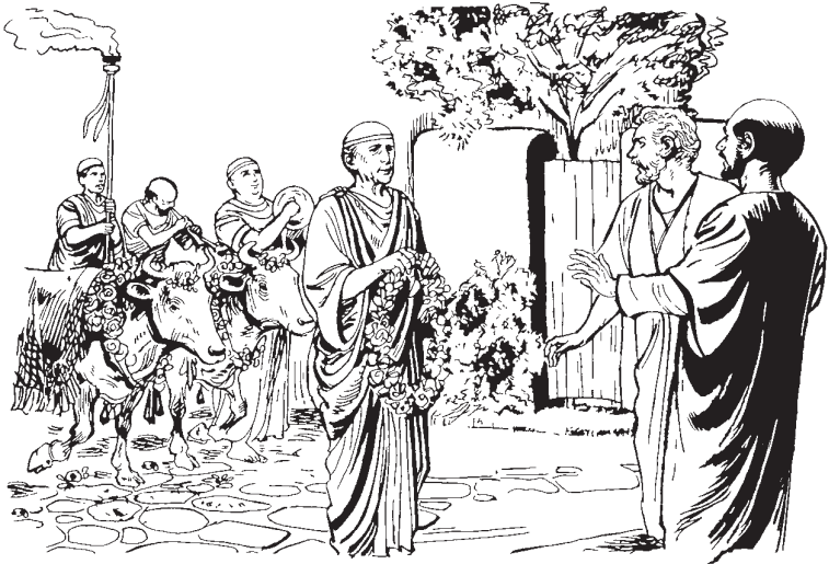
O imamu neowa kapopanga ne Paulus bhe Barnabas

14 Dofetingke peda maitu Barnabas bhe Paulus dopobhensi'ao pakeando poangka dotende ne wuntando mie bhahi bhe dokei ambado, 15 “Alee, noafa habu'ao'omu giu aitu? Insaodi ini ingka mie melaa, kabeanga dua hintimiu! Kahato'a mani ne ini tamohatoangkoomu Bhihita Metaa so humunsa'ao'omu giu tapa kofahalaa'ano ini, neanomo dumolimoomu bhe marasaemoomu ne Lahata'ala dumadino. Anoamo mokonandoono o lani, o dhunia, o te'i bhe kosasawi'ae i'ino. 16 Nandoo dhamani wawono Lahata'ala tanokatahodamo sabhaha bansano liwu damangkafi totono lalondo seemie-seemie. 17 Tamaka Anoa sadaa-daa nofotiwohaanda kantandaino Wutono. Aini ma'anano nofo'ondofao, nofosampuangkoomu use bhe pehapino wite seta'u-seta'u. Anoa nofekawe'ikoomu bhe nofeka'ia lalomiu.” 18 Mahinggamo rasulu dopugau peda na'a, mie bhahi nokoma'o pae datitagalia daesumbeleanda kapopanga.