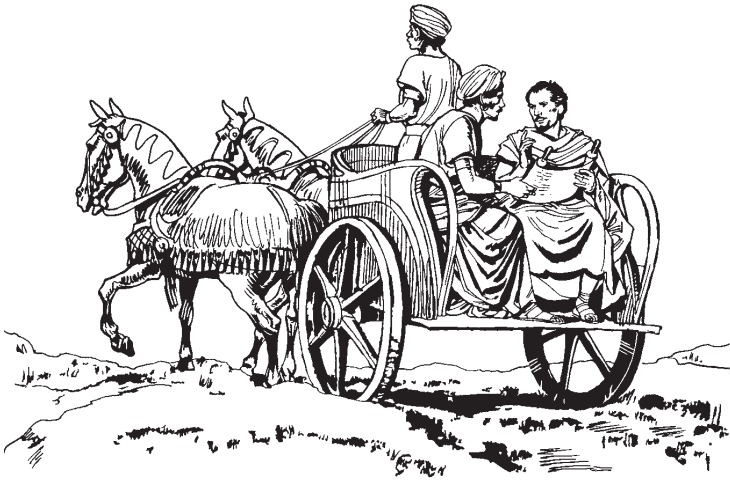
Filipus bhe kabhala mai'aono we Etiopia

maitu, “Ingka inia o oe, nandoo bhahaa nekaemiku ane daku-madiu kanaumo?” 37 [Notobhoosimo Filipus, “Ane nokampuumpuumo lalomua weo kaparasaeamu, naembalimo dakumadiuko.” Ambano toha, “Aparasaeamo Yesus Kristus Anano Lahata'ala.”] 38 Mieno Etiopia maitu notududamo damofetumpu kareta kasawi'ando. Kohoduando, Filipus bhe mieno Etiopia maitu, lasao dosampu weo oe maka Filipus nokadiu'e. 39 Dofoni domai'ao weo oe, Filipus tamba'omo nosangkee Rohino Ompu sampe miinamo naohaea kabhala mai'aono we Etiopia maitu, tamaka weo kawulano lalono nofopansuhumo kala-kalano. 40 Gaha'a nofengkana'ao lalono Filipus nohatomo we Asdod. Anoa nokala kansuhu poowa nefolele Bhihita Metaa ne sabhaha liwu ampa nohato we kotano Kaisarea.